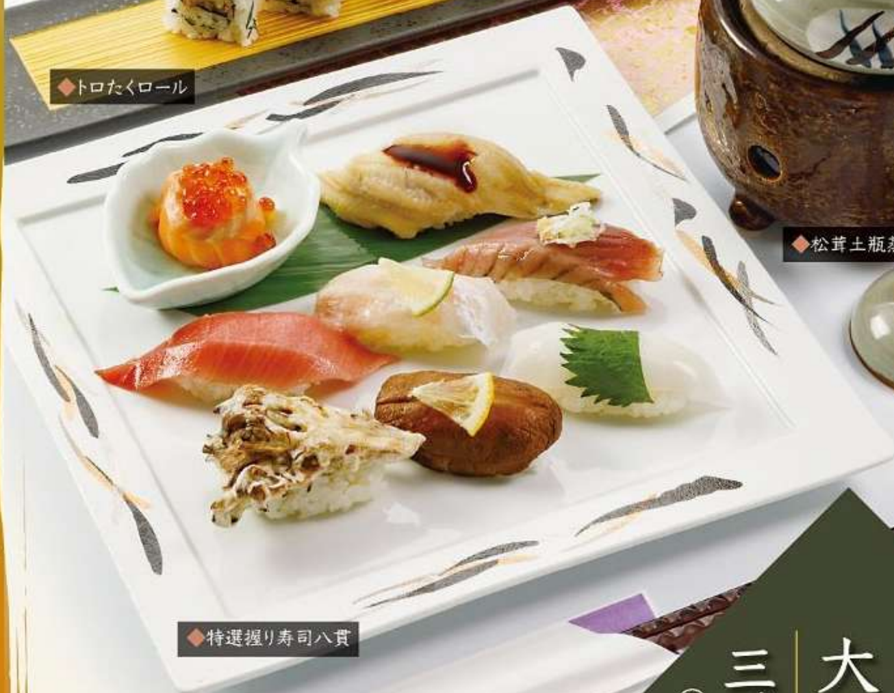
◆特選握り寿司八貫