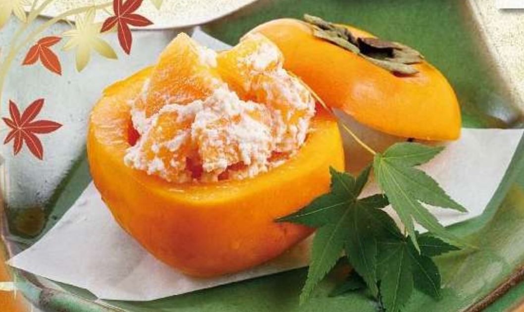
◆ 柿の白和え 800円(税込880円)