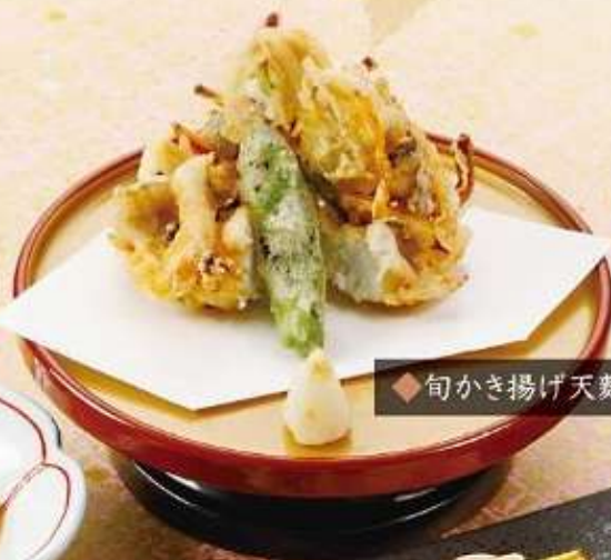
◆旬かき揚げ天麩羅