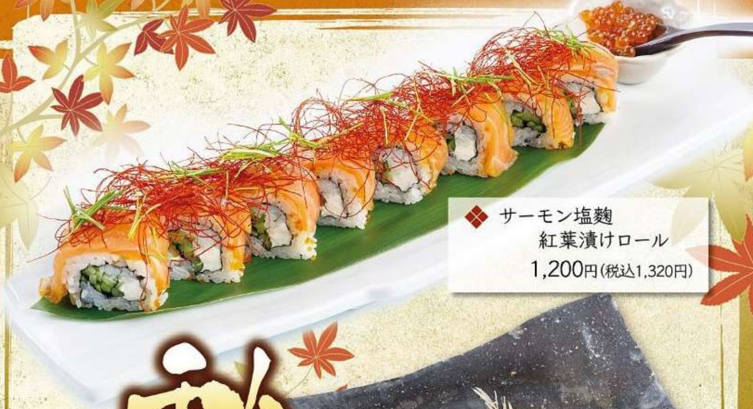
◆ サーモン塩麴 紅葉漬けロール 1,200円(税込1,320円)