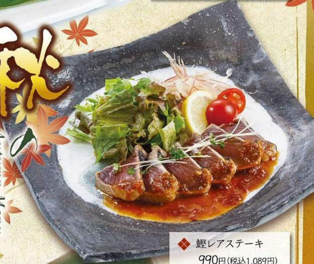
◆ 鰹レアステーキ 990円(税込1,089円)