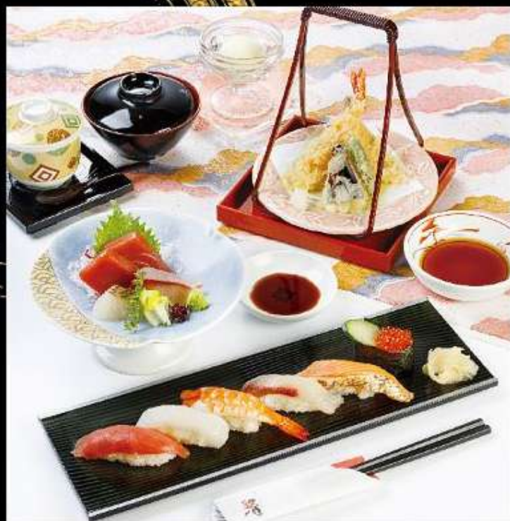
◆ 芙蓉 ふよう