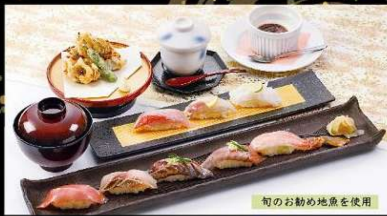
旬のお勧め地魚を使用

◆ 橘 寿司9貫・巻物1本 茶碗蒸し・お碗・デザート 2,700円 (税込2,970円)