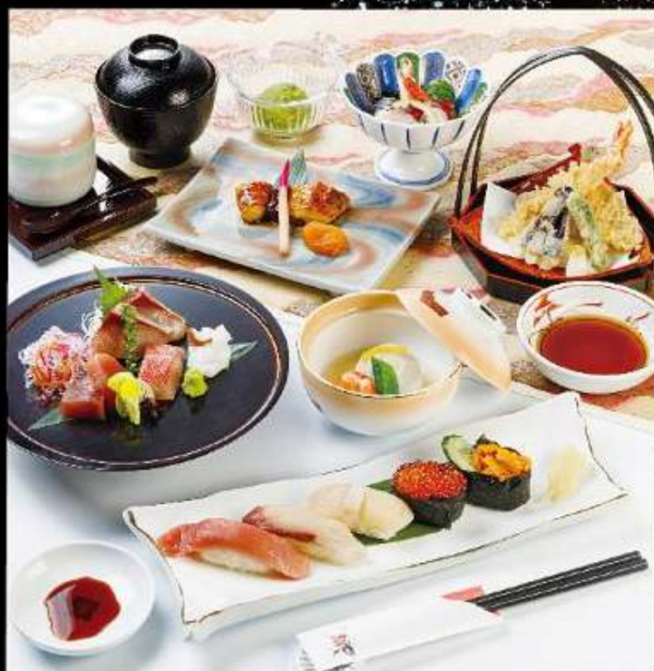
◆ 睡蓮 すいれん