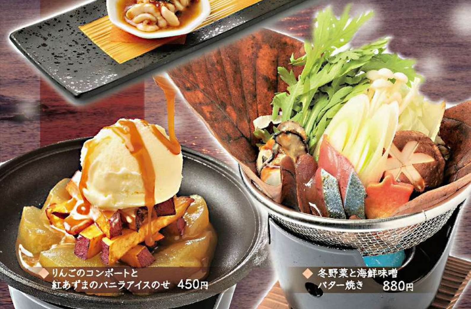
◆ りんごのコンポートと 紅あずまのバニラアイスのせ 450円