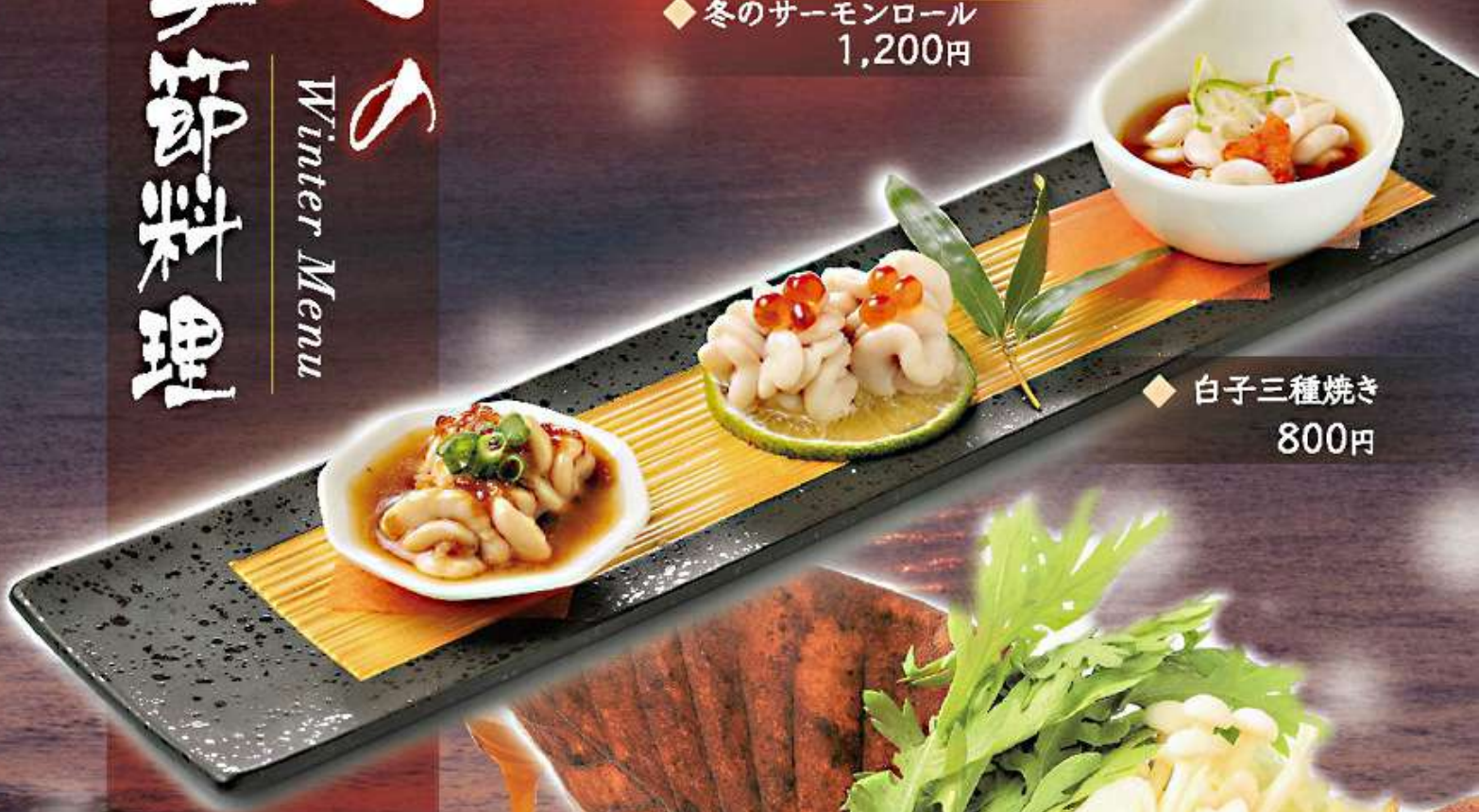
◆ 白子三種焼き 800円