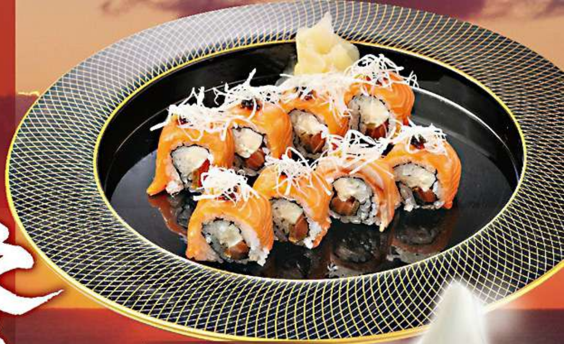
◆ 冬のサーモンロール 1,200円