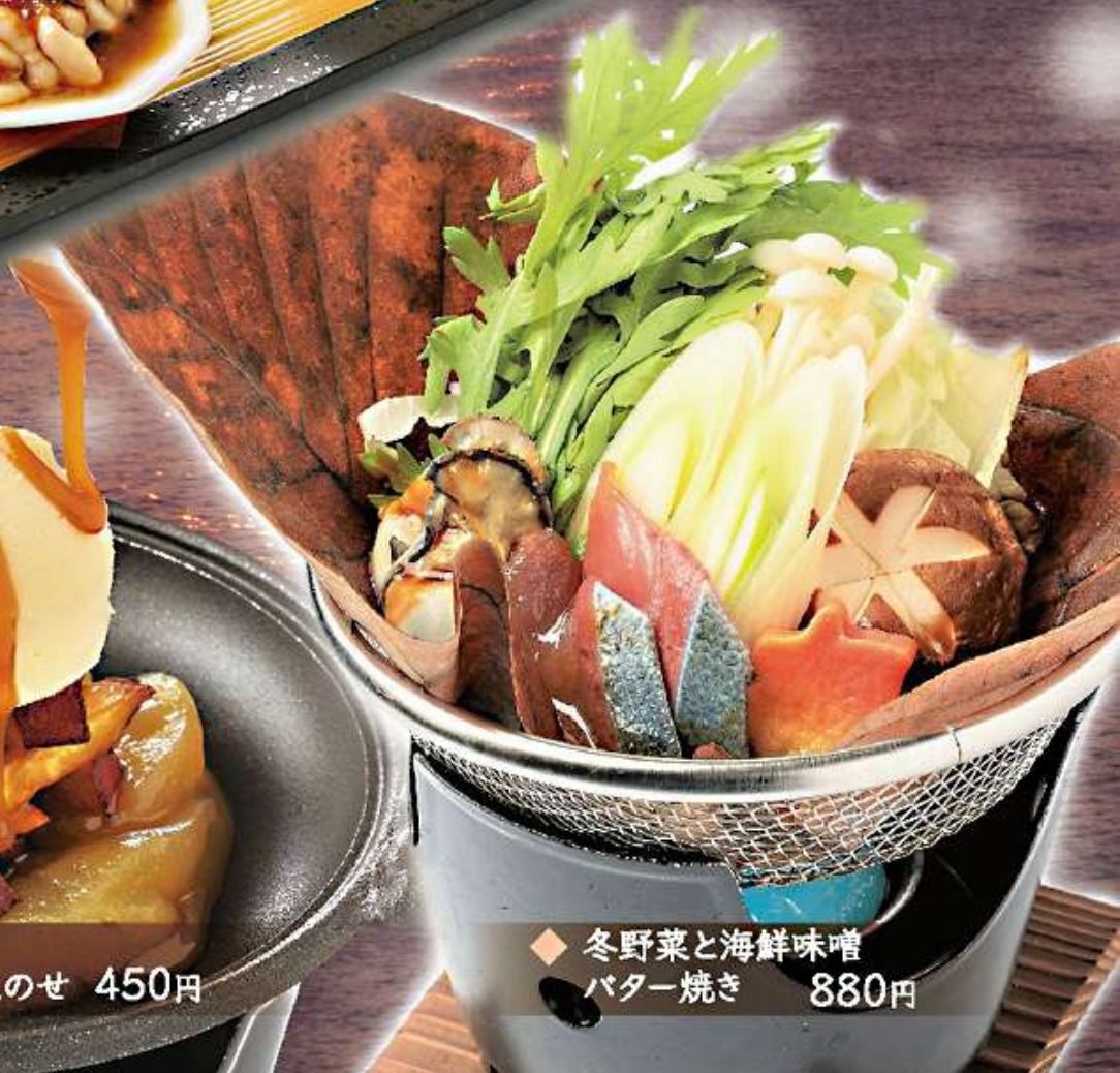
◆ 冬野菜と海鮮味噌 バター焼き 880円