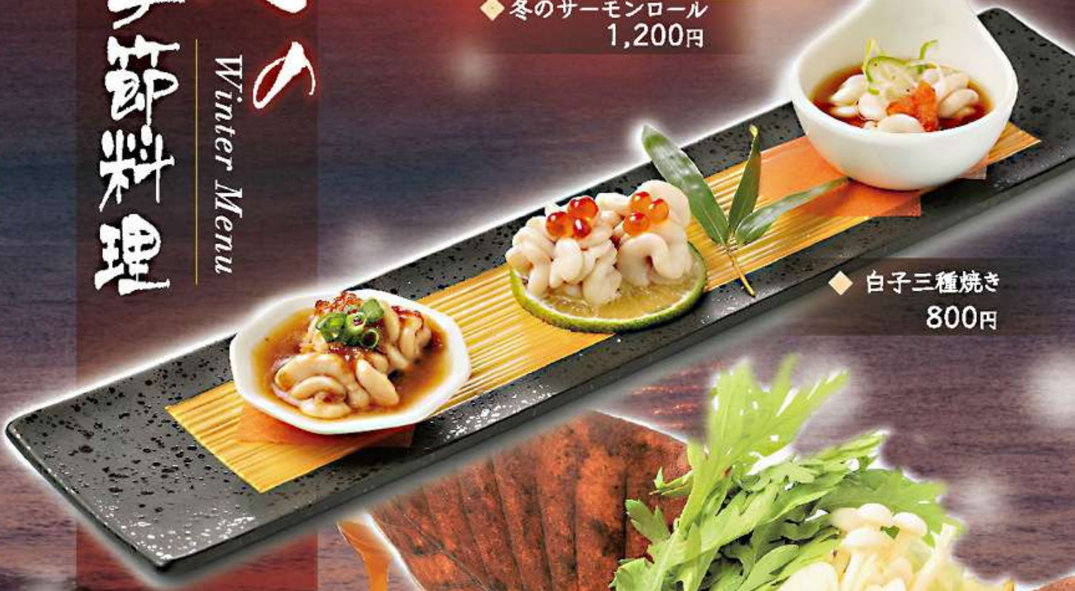
◆ 白子三種焼き 800円