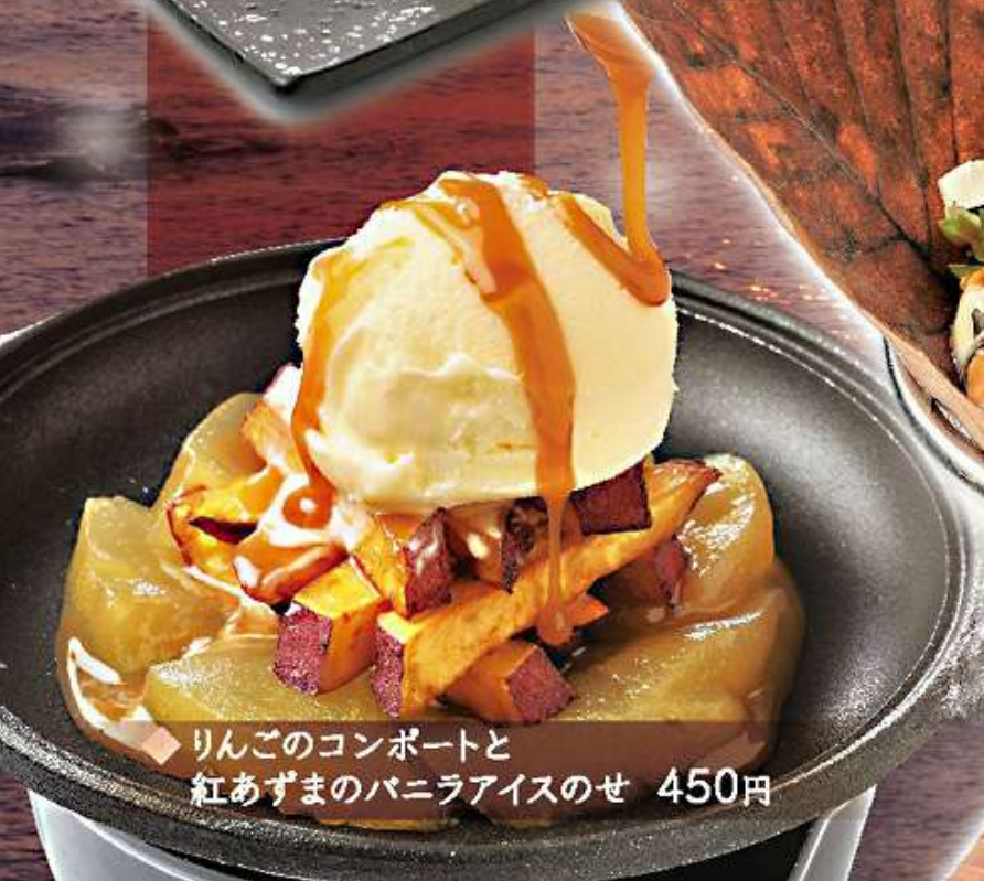
◆ りんごのコンポートと 紅あずまのバニラアイス のせ 450円