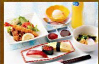
◇ お子様セットB 1,300円 ソフトドリンク・お菓子付き