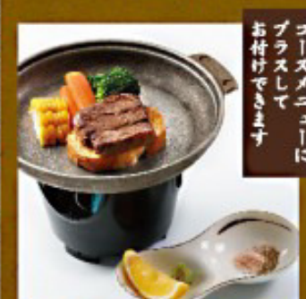
和牛陶板ステーキ 1,200円