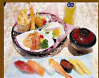
◇ お子様セットA 2,300円 ソフトドリンク・お菓子付き