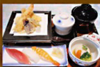
◇ 供養膳 2,000円